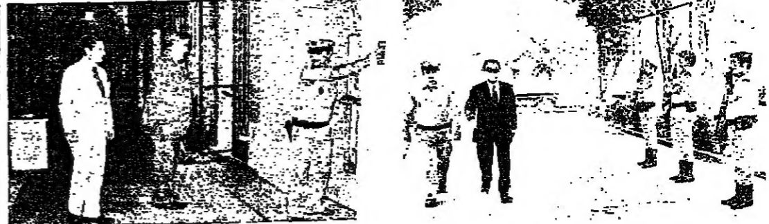
السفير الأمريكي غونلي بانتظار السيد كراي لدى وصوله الى المراسم